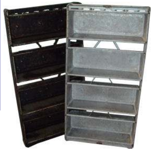
Vervuild koppel en een gereinigd koppel

Reden voor reiniging kunnen zijn slechte warmte geleiding door overtollig vet of loslaten van de vetlaag waardoor u zwarte stukjes aan u product krijgt.